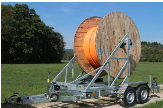
- Ohne Kabel und Kabeltrommel -

Für Kabeltrommeln bis ca. 2,8 m Ø und einer Breite von ca. 1,64 m